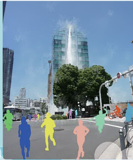
北浜東 アクアタワー