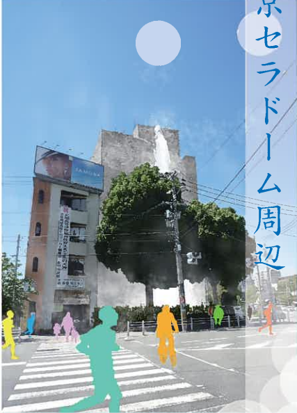
京セラドーム周辺